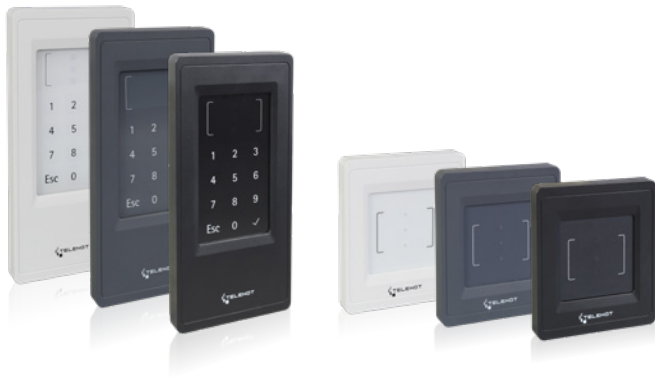
Das Modehaus regelt den Zutritt mit einem cryptlock-RFID-Leser von TELENOT.

Mit dem Zutrittskontrollleser wird außerdem der Zugang zu Räumen, die nicht für jeden offenstehen, geregelt. Mitarbeiter erhalten einen Transponderchip und können damit beispielsweise Lagerräume betreten. Kein Schlüssel kann aus Versehen im Schloss stecken gelassen werden. Geht ein Transponderchip verloren, besteht kein Grund zur Sorge: Anstatt das komplette Schloss auszutauschen, wird der verloren gegangene Chip gesperrt und ein neuer ausgegeben.