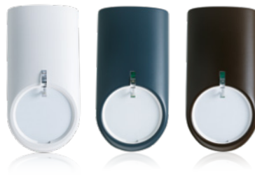
In verschiedenen Designcovern erhältlich: der Bewegungsmelder comstar VAYO pro.

Im Innenbereich des Marktes sind Bewegungsmelder angebracht. Dadurch lassen sich auch Eindringlinge erkennen, die sich auf anderen Wegen Zugang verschafft haben, oder die sich als „Einschleichtäter“ tagsüber im Objekt versteckt haben.