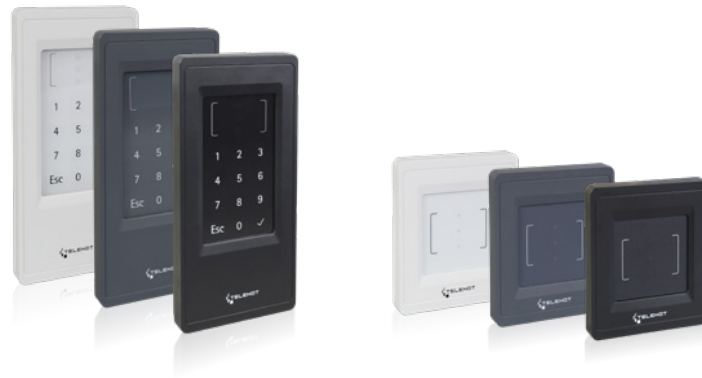
Die Eingangstüren und Bereiche, die nur von bestimmten Mitarbeitern betreten werden dürfen, sind mit cryptlock-RFID-Lesern ausgestattet.

Mit weiteren Zutrittskontrolllesern ist der Zugang zu Räumen geregelt, die nicht für jeden zugänglich sein dürfen. Mitarbeiter erhalten einen Transponderchip und können damit beispielsweise das Warenlager betreten. Geht ein Chip verloren, besteht kein Grund zur Sorge: Anstatt das komplette Türschloss auszutauschen, wird der verlorene Chip einfach gesperrt und der betroffene Mitarbeiter erhält einen neuen. Das lässt sich problemlos vom Personalbüro aus der Ferne regeln.