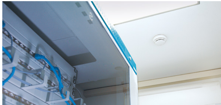
Der automatische Brandmelder von TELENOT schützt den Serverraum vor Brand.