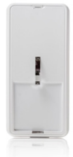
Bewegungsmelder histar 1000