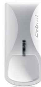
Das Gehäuse des Bewegungsmelders comstar pro stammt von Designer Luigi Colani.