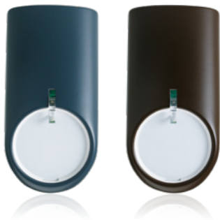
In verschiedenen Designcovern erhältlich: der Bewegungsmelder comstar VAYO pro

Ein weiterer Vorteil der TELENOT-Alarmanlage: Sie ermöglicht die Scharfschaltung einzelner Räume oder Raumbereiche, sodass die Anlage bei Anwesenheit aktiviert werden kann. Insofern kann auch nach Geschäftsschluss weiter gearbeitet werden.